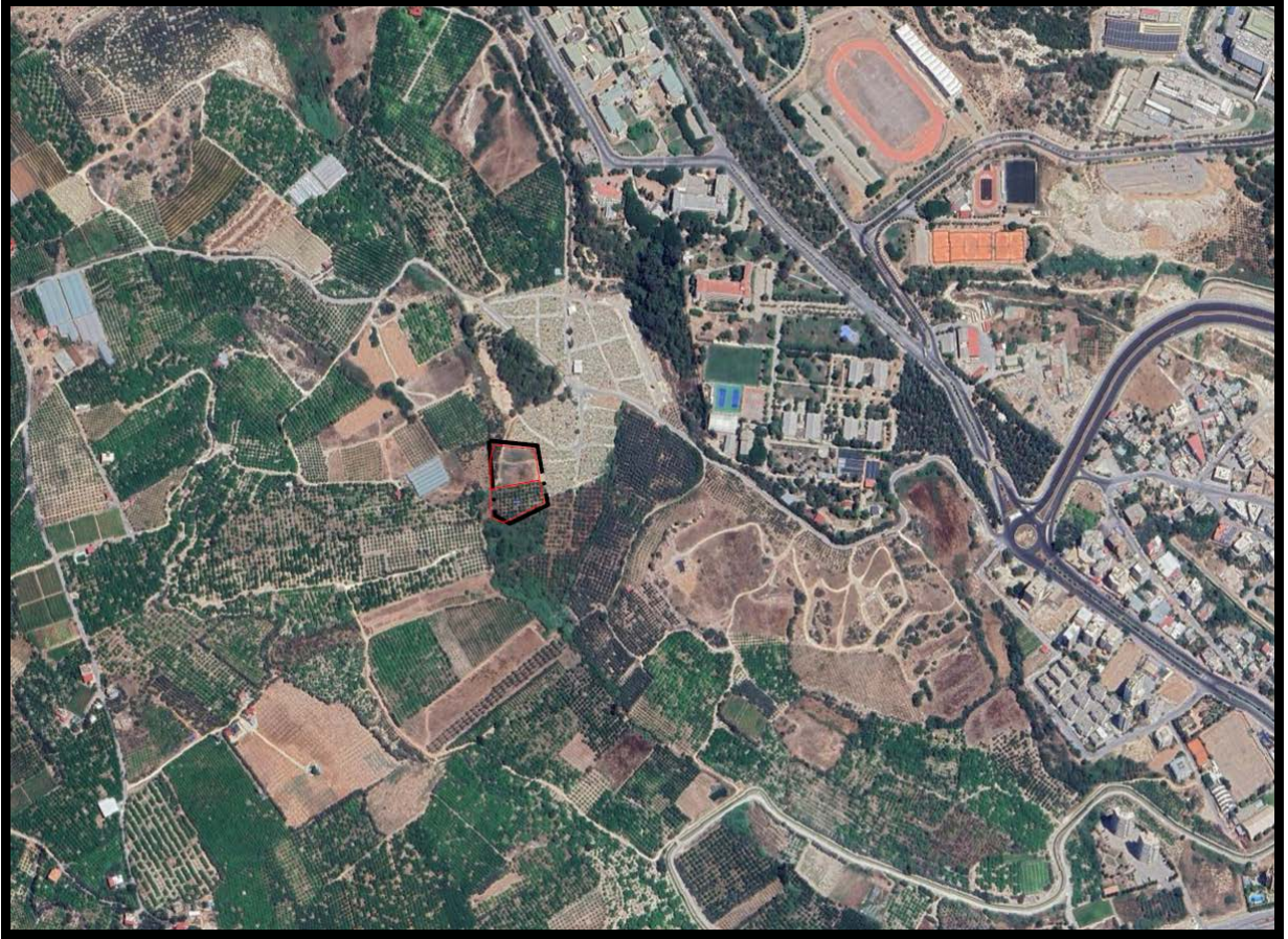
Şekil 1. Planlama Alanının Konumu

Nazım imar planı konu edilen alan Mersin İli, Yenişehir İlçesi Çiftlik Mahallesi 9658 ada 1 ve 2 parsel numaralı taşınmazları kapsamakta olup plan değişikliği sınırı alanı yaklaşık 4809 m 2 büyüklüğündedir. 1/5000 ölçekli O33-A-21-A-3-C, O33-A-21-B-4-D hâlihazır paftasında yer almaktadır.