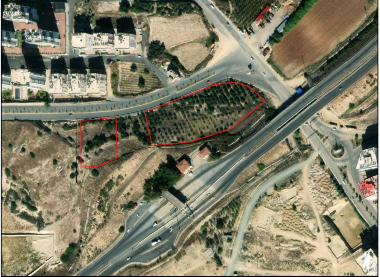
Şekil 1. Planlama Alanının Konumu

Uygulama imar planı konu edilen alan Mersin İli, Tarsus İlçesi Atatürk Mahallesi 4926 ada 2 parsel ve çevresini kapsamakta olup plan değişikliği sınırı alanı yaklaşık 14.874 m 2 büyüklüğündedir. 1/1000 ölçekli O33-B-08-A-1C ve O33-B-08-A-1D halihazır paftalarında yer almaktadır. (Şekil 1.)