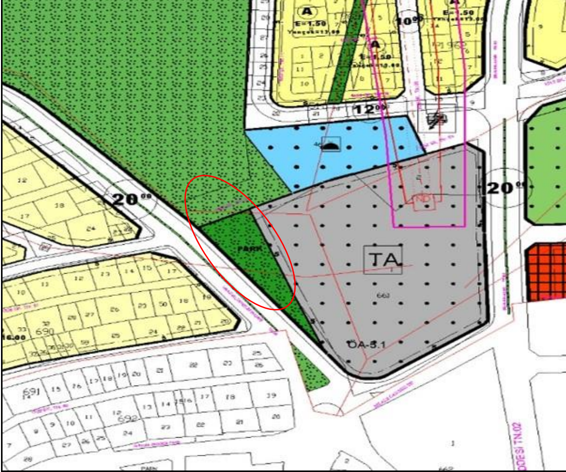
Şekil 2: Yürürlükteki 1/1000 Ölçekli Uygulama İmar Planı

Söz konusu alan yürürlükte bulunan 1/1000 ölçekli Uygulama İmar Planında ise kısmen "Mezarlık Alanı, Park Alanı ve Teknik Altyapı Alanı" olarak işaretlidir.