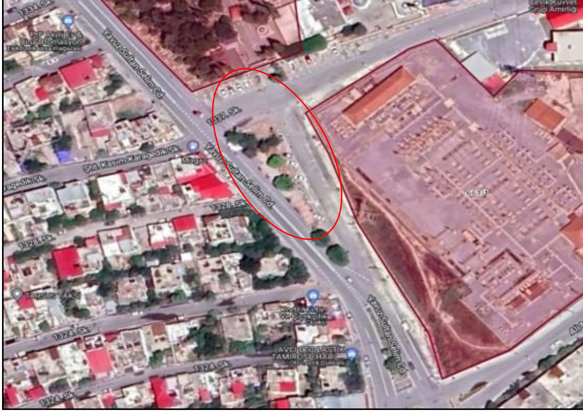
Şekil 1: Planlama Alanının Konumu

İmar planı deęişikliğine konu edilen alan, Tarsus İlçesi, Çağlayan Mahallesi sınırları içerisinde, Şehir Mezarlığının güneyinde Yavuz Sultan Selim Caddesi üzerinde yer almakta olup 1/1000 ölçekli 033B08B3C halihazır paftasında yer almaktadır.