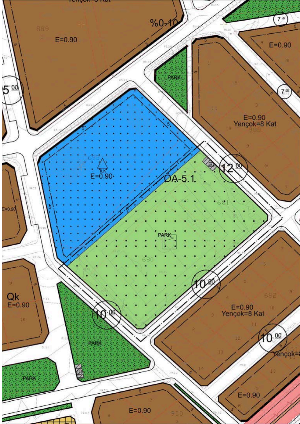
Şekil-6 Mersin İli, Mezitli İlçesi, Mezitli 680 Ada 1 Parsel ve 681 Ada 1 Parsele İlişkin 1/1000 Ölçekli Uygulama İmar Planı Değişikliği

Mersin İli, Mezitli İlçesi, Mezitli 680 Ada 1 Parsel ve 681 Ada 1 Parsele İlişkin 1/1000 Ölçekli Uygulama İmar Planı Değişikliği ile söz konusu parseller üzerinde halihazırda spor sahası bulunması ve bununla birlikte, bölgede artan spor alanı ihtiyacının karşılanabilmesi amacıyla planlanan projeler kapsamında, “Açık Spor Tesisi Alanı” olarak planlanmıştır.