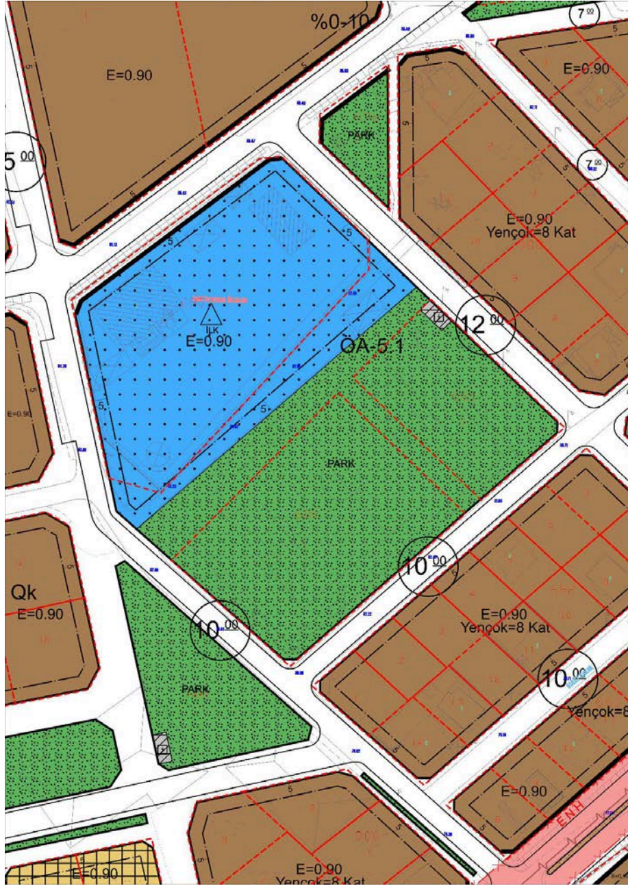
Şekil-3 Mezitli II.Etap (Mezitli Planlama Bölgesi) 1/1000 Ölçekli Revizyon ve İlave Uygulama İmar Planı

Nazım imar planı kararları doğrultusunda hazırlanan ve Mezitli Belediye Meclisinin 05.07.2019 tarih ve 98 sayılı kararı ile Mersin Büyükşehir Belediye Meclisinin 14.02.2020 tarih ve 132 sayılı kararı ile kabul edilen Mezitli II. Etap (Mezitli Planlama Bölgesi) 1/1000 Ölçekli Revizyon ve İlave Uygulama İmar Planı Şekil-3'te gösterilmektedir.