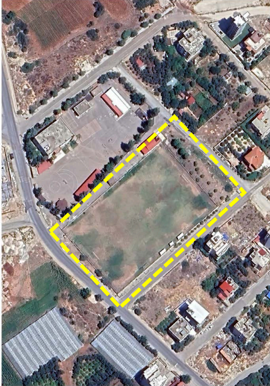
Şekil-1: Plan değişikliğine konu edilen alanın uydu görüntüsündeki konumu

Mersin İli, Mezitli İlçesi, Mezitli 680 Ada 1 Parsel ve 681 Ada 1 Parsele İlişkin 1/1000 Ölçekli Uygulama İmar Planı Değişikliğine konu edilen alan, yaklaşık 8300 m 2 alan büyüklüğüne sahiptir (Şekil-1).