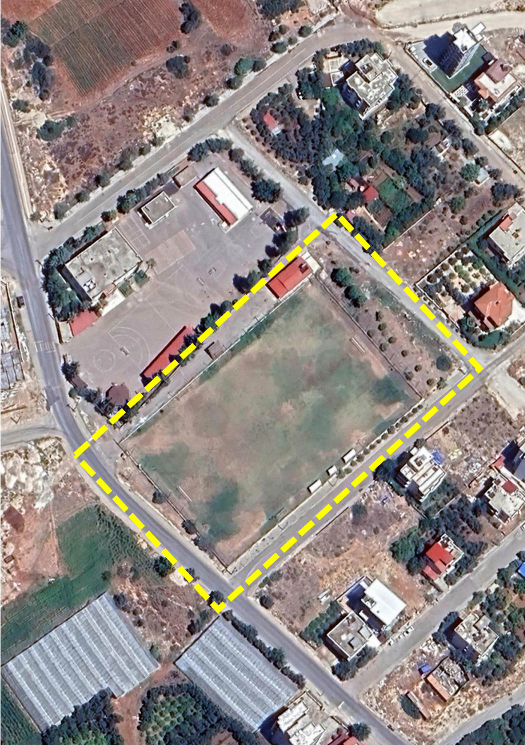
Şekil-1: Plan değişikliğine konu edilen alanın uydu görüntüsündeki konumu

Mersin İli, Mezitli İlçesi, Mezitli 680 Ada 1 Parsel ve 681 Ada 1 Parsele İlişkin 1/5000 Ölçekli Nazım İmar Planı Değişikliğine konu edilen alan, yaklaşık 8300 m 2 alan büyüklüğüne sahiptir (Şekil-1).