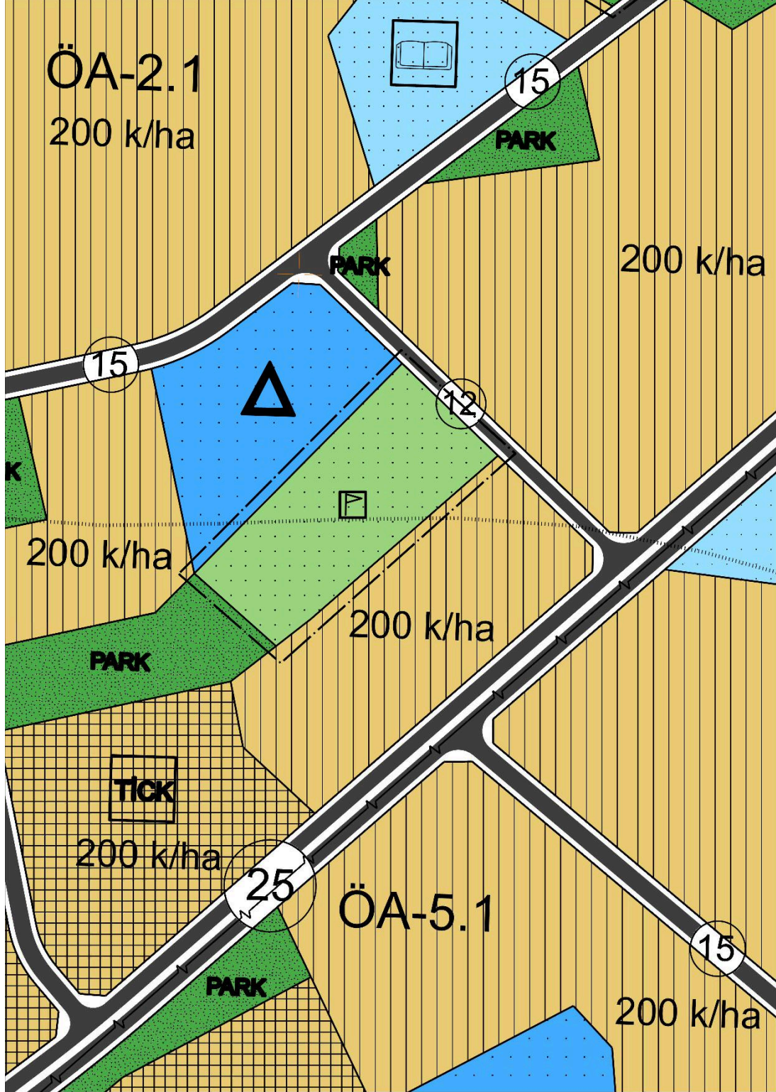
Şekil-6 Mersin İli, Mezitli İlçesi, Mezitli 680 Ada 1 Parsel ve 681 Ada 1 Parsele İlişkin 1/1000 Ölçekli Uygulama İmar Planı Değişikliği

Mersin İli, Mezitli İlçesi, Mezitli 680 Ada 1 Parsel ve 681 Ada 1 Parsele İlişkin 1/5000 Ölçekli Nazım İmar Planı Değişikliği ile söz konusu parseller üzerinde halihazırda spor sahası bulunması ve bununla birlikte, bölgede artan spor alanı ihtiyacının karşılanabilmesi amacıyla planlanan projeler kapsamında, “Açık Spor Tesisi Alanı” olarak planlanmıştır.