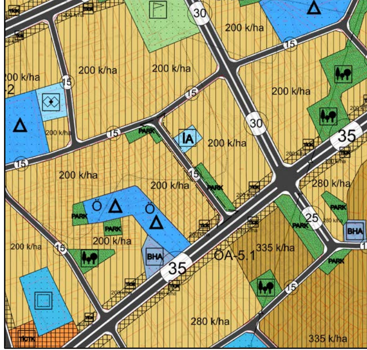
Şekil 2: Plan deęişikliği öncesi 1/5000 ölçekli Nazım İmar Planı

Söz konusu deęişiklik ile 15 m en kesitli taşıy yolu olan alan, Park ve Yeşil Alan olarak Şekil 3'teki görüldüğü şekliyle 1/5000 Nazım İmar planına işaretilmesi önerilmiştir.