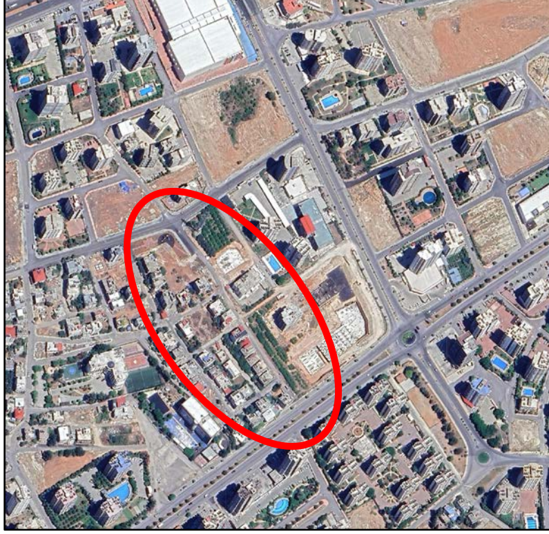
Şekil 1: Plan değişikliği alanın uydu görüntüsü

1/5000 ölçekli Nazım İmar Planında söz konusu alan, 15 metre (m) en kesitli taşıt yoluna isabet etmektedir.