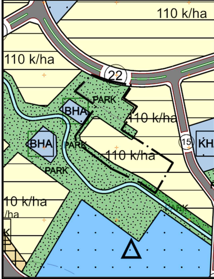
Şekil 5: Nazım İmar Planı Değişikliği Teklifi.

hazineden tahsisli ve yapılaşma açısından uygun olan alanda “Konut Alanı” düzenlemesi yapılmıştır. Planlama alanında konut alanı olarak düzenlenen kısım 1/5000 ölçekli Nazım imar planında “110 k/ha Düşük Yoğunluklu Gelişme Konut Alanı “ olarak işaretlenmiştir . Yapılan düzenleme ile parsellerin güney sınırında yer alan DSİ kanalına cepheli olan kısım “Park Alanı” olarak korunarak yatay aksta yeşil aksın sürekliliği bozulmamıştır.(Şekil.5)