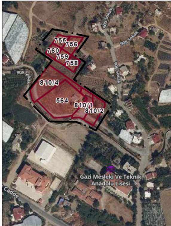
Şekil 1: Plan Değişikliği Yapılan Alanın Uydu Görüntüsü

Parsel konum olarak Kalınören mahallesi sınırlarında kent merkezinin kuzey batısında kısmen yapılanmakta olan kentsel doku içerisinde yer almakta olup , Gazi Meslek ve Teknik Anadolu Lisesinin kuzeyindedir.(Şekil.1)