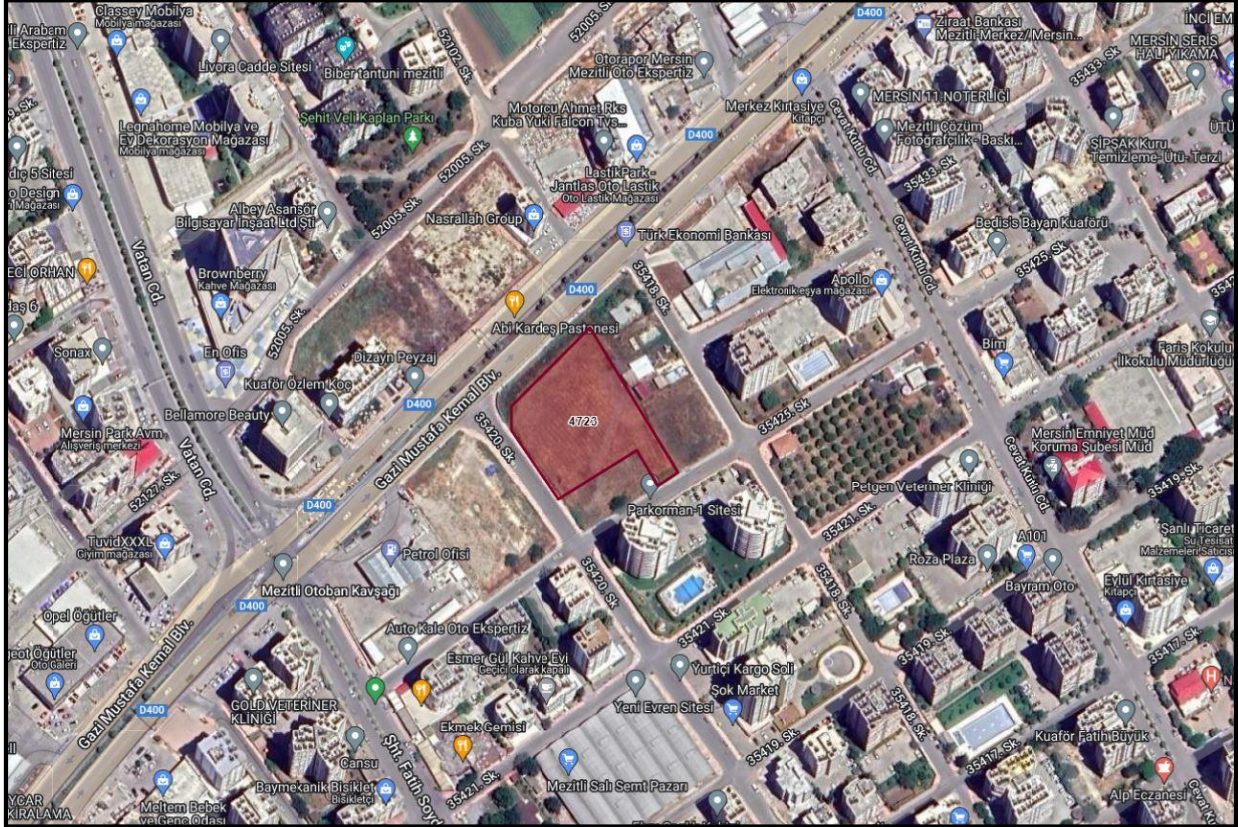
Harita 1:Planlama Alanı Uydu Görüntüsü

Nazım İmar Planı değişikliği teklifine konu parcel tapunun Mersin İli, Mezitli İlçesi, Mezitli (Merkez) Mahallesi, O33-D-01-A pafta, 4723 no.lu parselde kayıtlı olup toplam 3600 m2 büyüklüğe sahiptir. Parseller Mezitli Belediyesi sınırları dahilinde ve 1/5000 ölçekli O33-D-01-A halihazır paftasında yer almaktadır. Parselin konumunu gösteren uydu fotoğrafı aşağıda gösterilmiştir.