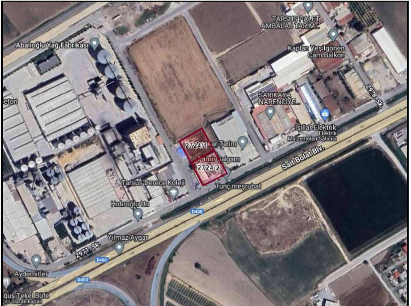
Harita 1: Planlama Alanı Uydu Görüntüsü

Nazım İmar Planı değişikliği teklifine konu parseller tapunun Mersin İli, Tarsus İlçesi Mithatpaşa Mahallesi, O33-b-08-d, O33-b-13-a paftalarında, 2724 ada 1 nolu parsel 2423 m 2 ve 2 nolu parsel 2657 m 2 parsellerde kayıtlı olup toplam 5080 m 2 büyüklüğe sahiptir. Parseller Tarsus Belediyesi sınırları içerisinde ve 1/5000 ölçekli O33-b-08-d, O33-b-13-a hâlihazır paftalarında 4 086 000 - 4 086 500 yatay, 398 500 – 399 000 dikey koordinatları arasında yer almaktadır. Parsellerin konumunu gösteren uydu fotoğrafı aşağıda gösterilmiştir.