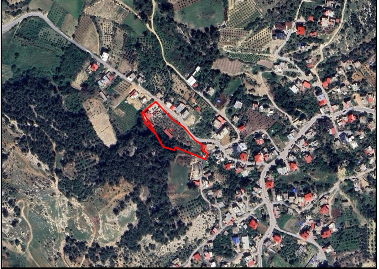
Şekil 1. Planlama Alanının Konumu

İmar planı tadilatına konu edilen alan Toroslar İlçesi sınırları içerisinde Resulköy Mahallesinde, Resulköy Cami'sinden 200 m kuzeyde bulunmaktadır.