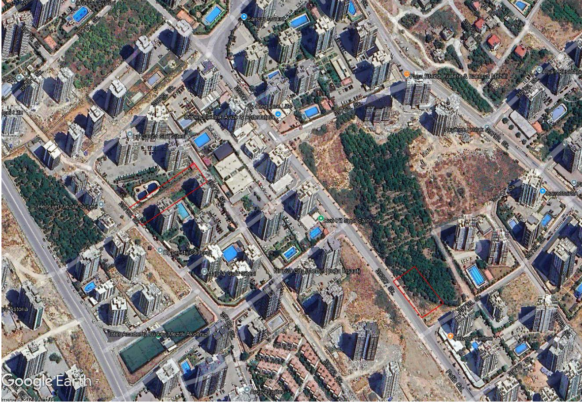
Şekil 1: Plan değişikliğine konu edilen alanın uydu görüntüsündeki konumu

1/5000 Ölçekli Uygulama İmar Planı Değişikliği teklifine konu edilen alan; mülkiyeti Mezitli Belediye'sine ait, tapuda Mersin İli, Mezitli İlçesi, Mezitli Mahallesi, 1099 Ada 10 Parsel ile Mezitli İlçesi, Mezitli Mahallesi 1122 Ada, 1 Parselin güneyinde, 1121 Ada 3 Parselin batısında, Fatih Caddesi üzerinde yer alan park alanını kapsamakta olup, 1/5000 ölçekli O32C05B ve O33D01A hâlihazır paftasında yer almaktadır. (Şekil-1)