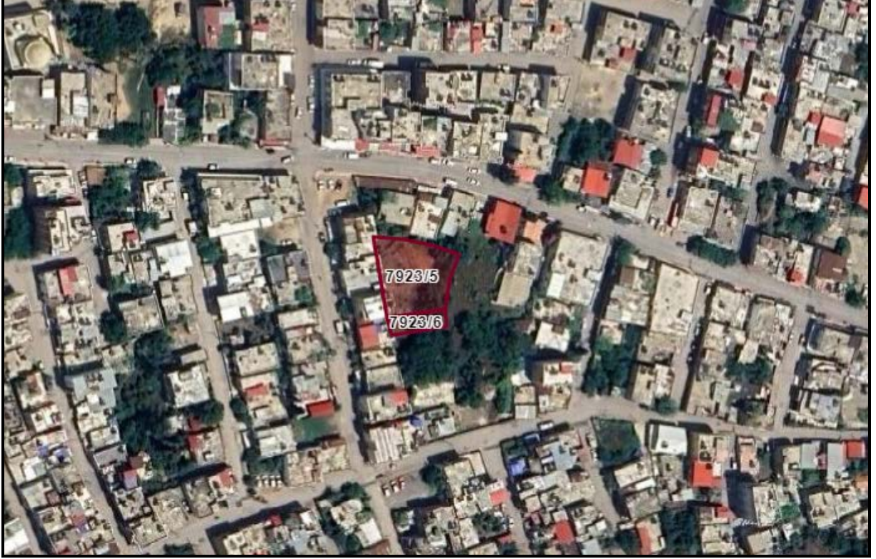
Şekil 1. Planlama Alanının Konumu

İmar planı değişikliğine konu edilen alan tapuda Yenişehir İlçesi Bahçe Mahallesi'nde 7923 ada 5 ve 6 parsellerde kayıtlı, Mersin Yumuktepe Höyüğü'nün doğusunda Soğuksu Caddesi ile 76076 sokak kesişiminde konumlanmaktadır.