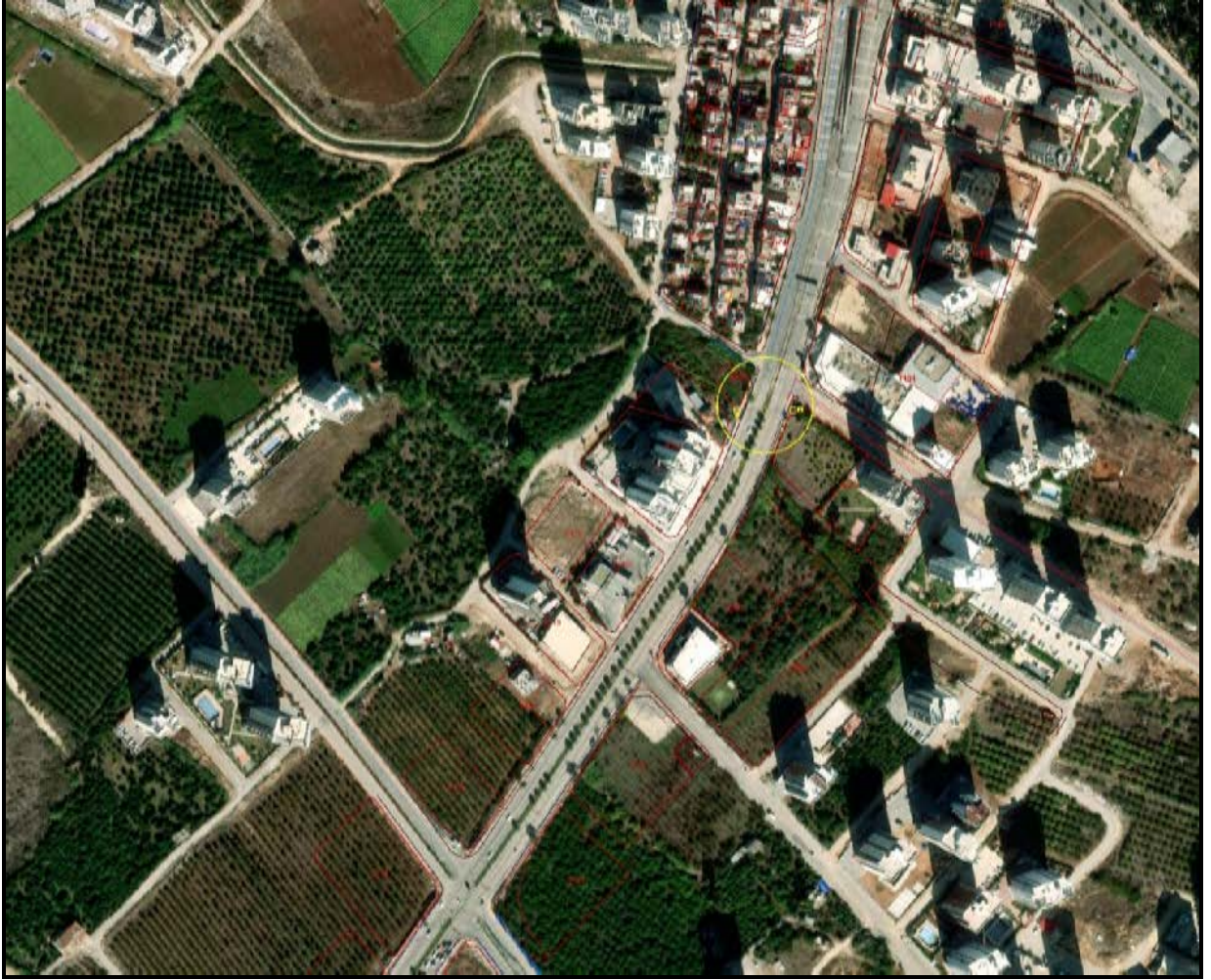
Şekil 1. Planlama Alanının Konumu

İmar planı tadilatına konu edilen alan tapuda Toroslar İlçesi, Portakal Mahallesi Milli Mücahit Rıfat Uslu Caddesi ile 203. Cadde kesişiminde konumlanmaktadır.