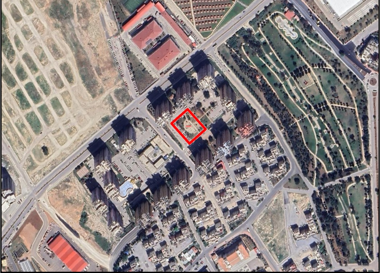
Şekil 1. Planlama Alanının Konumu

İmar planı tadilatına konu edilen alan tapuda Toroslar İlçesi Arpaçsakarlar Mahallesi'nde 9054 ada 1 parselde kayıtlı olup Cumhuriyet Evleri Sitesi içerisinde bulunmaktadır.