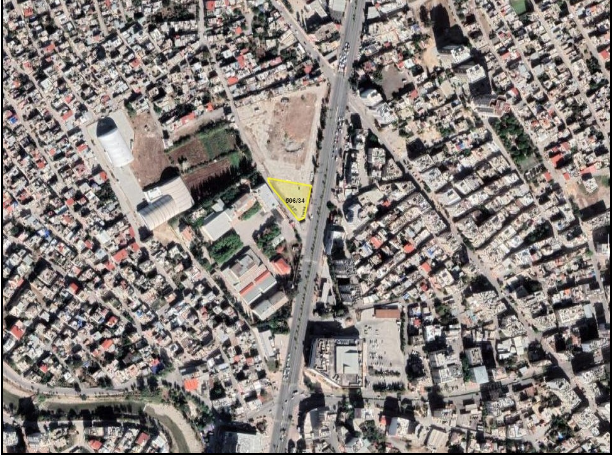
Şekil 1. Planlama Alanının Konumu

İmar planı tadilatına konu edilen alan tapuda Yenişehir İlçesi Bahçe Mahallesi'nde 506 Ada 34 parselde kayıtlı olup Gazi Mustafa Kemal Bulvarı üzerinde konumlanmaktadır.