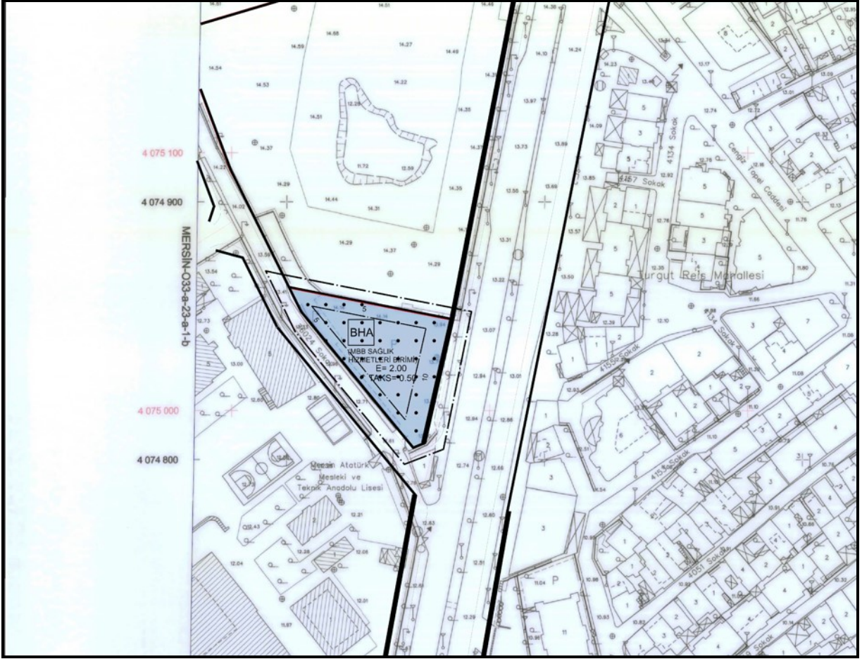
Şekil 3. Yürürlükteki 1/1000 Ölçekli Uygulama İmar Planı (Mersin Büyükşehir Belediye Meclisi'nin 14.06.2022 tarih ve 312 sayılı kararı)