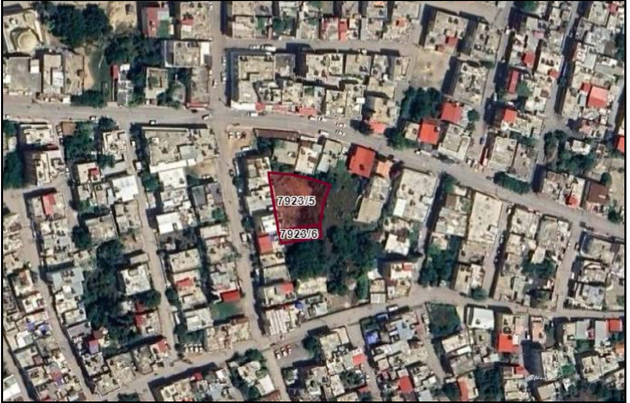
Şekil 1. Planlama Alanının Konumu

İmar planı tadilatına konu edilen alan tapuda Yenişehir İlçesi Bahçe Mahallesi'nde 7923 ada 5 ve 6 parsellerde kayıtlı, Mersin Yumuktepe Höyüğü'nün doğusunda Soğuksu Caddesi ile 76076 sokak kesişiminde konumlanmaktadır.