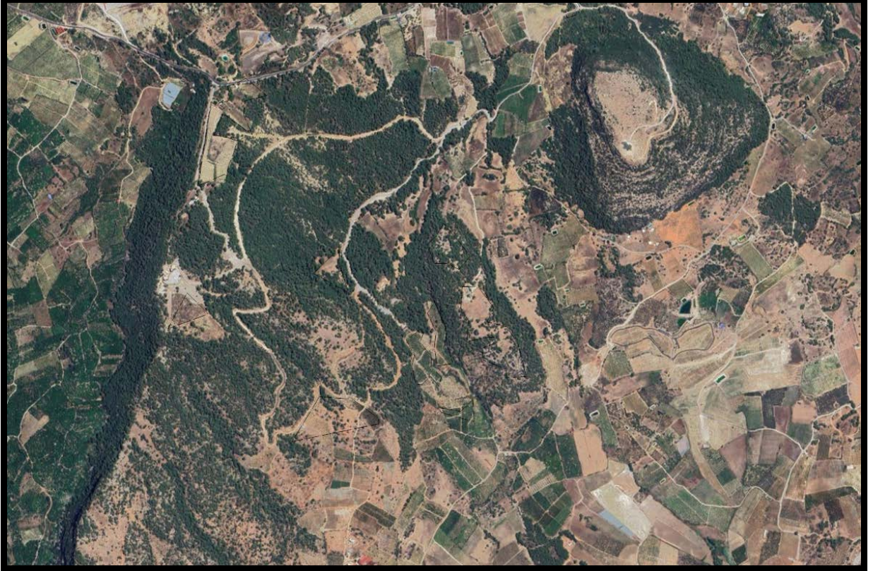
Şekil 1. Planlama Alanının Konumu

Nazım imar planı konu edilen alan Mersin İli, Yenişehir İlçesi Emirler Mahallesi sınırları içerisinde kalmaktadır. 1/5000 ölçekli O32-B-20-B, O32-B-20-C, O33-A-16-D hâlihazır paftalarında yer almaktadır.