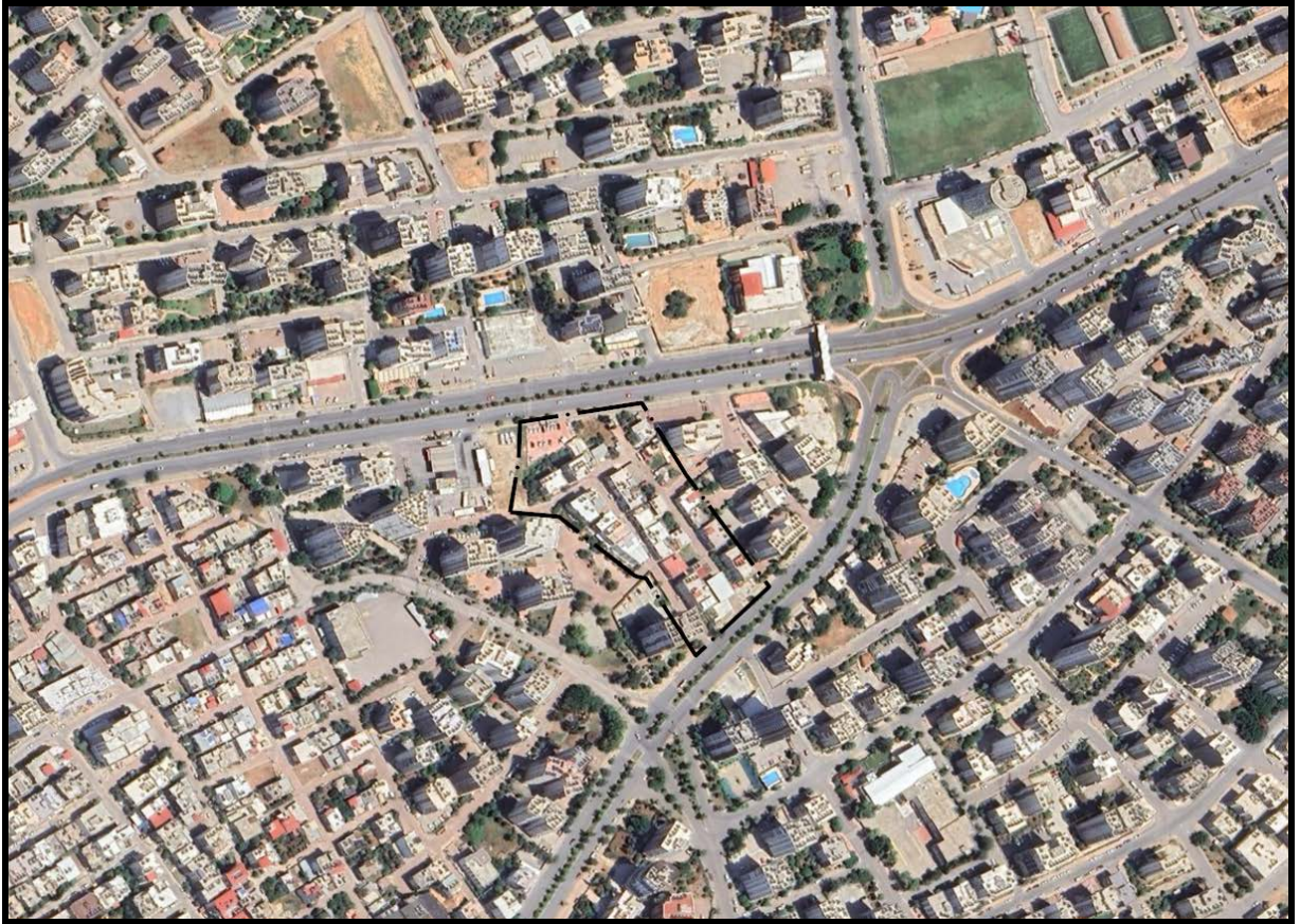
Şekil 1. Planlama Alanının Konumu

Nazım imar planı konu edilen alan Mersin İli, Yenişehir İlçesi Menteş Mahallesi 6613 ada 13 parsel numaralı taşınmaz ve çevresini kapsamakta olup plan değişikliği sınırı alanı yaklaşık 18160 m 2 büyüklüğündedir. 1/5000 ölçekli O33A22B hâlihazır paftasında yer almaktadır.