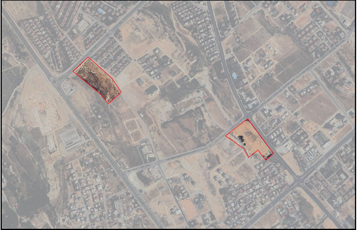
Şekil 1. Planlama Alanının Konumu

1/5000 Ölçekli nazım imar planı konu edilen alan Mersin İli, Yenişehir İlçesi Kocavilayet Mahallesi 739, 740 ve 741 parseller ile çevresini kapsamakta olup plan değişikliği sınırı alanı yaklaşık 494506.042 m 2 büyüklüğündedir. 1/5000 ölçekli O33A16C ve O33A17D hâlihazır paftasında yer almaktadır.