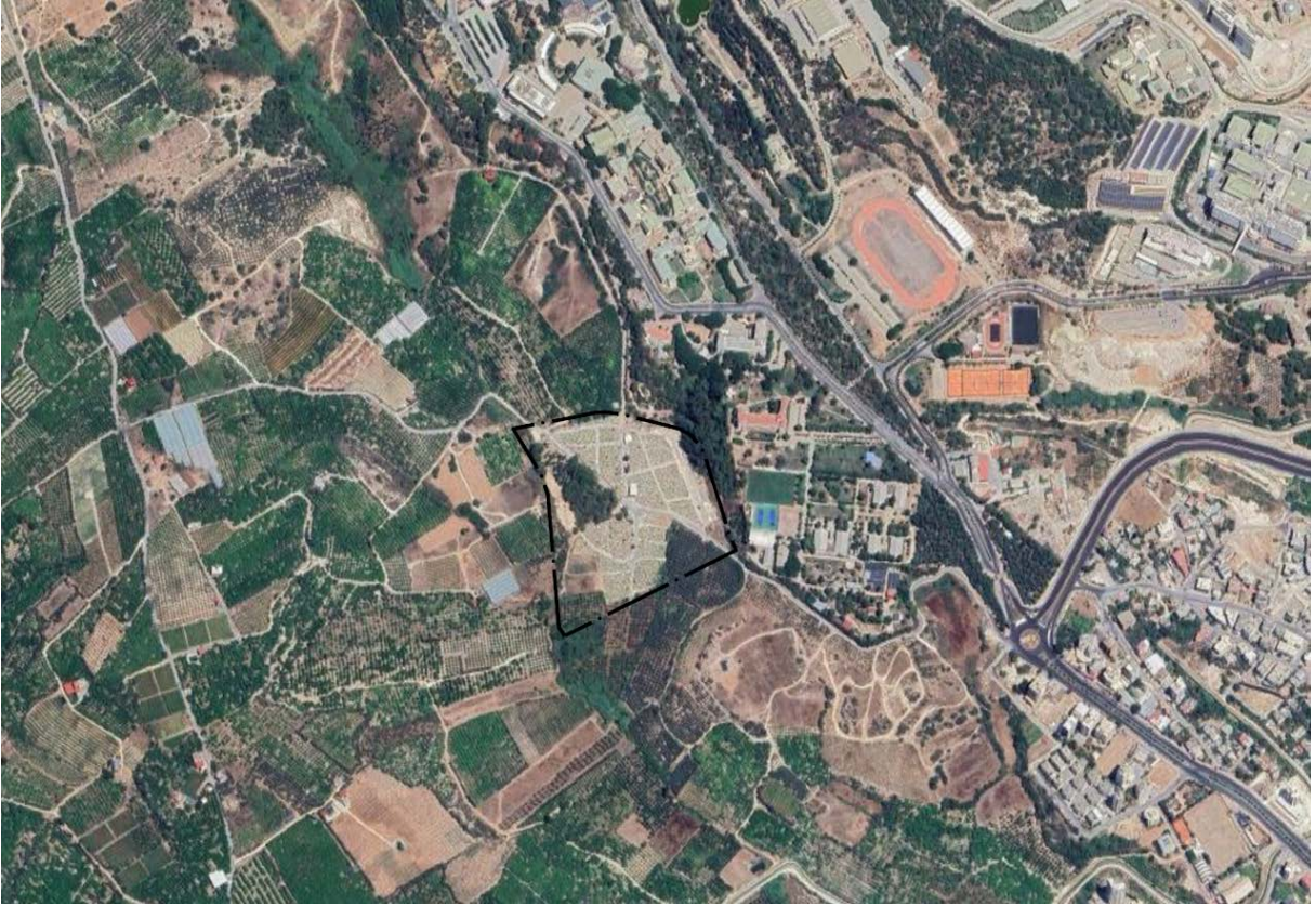
Şekil 1. Planlama Alanının Konumu

Nazım imar planı konu edilen alan Mersin İli, Yenişehir İlçesi Çiftlik Mahallesi Çiftlikköy mezarlığı ve çevresini kapsamakta olup plan değişikliği sınırı alanı yaklaşık 66000 m 2 büyüklüğündedir. 1/5000 ölçekli O33-A-21-A, O33-A-21-B hâlihazır paftasında yer almaktadır.