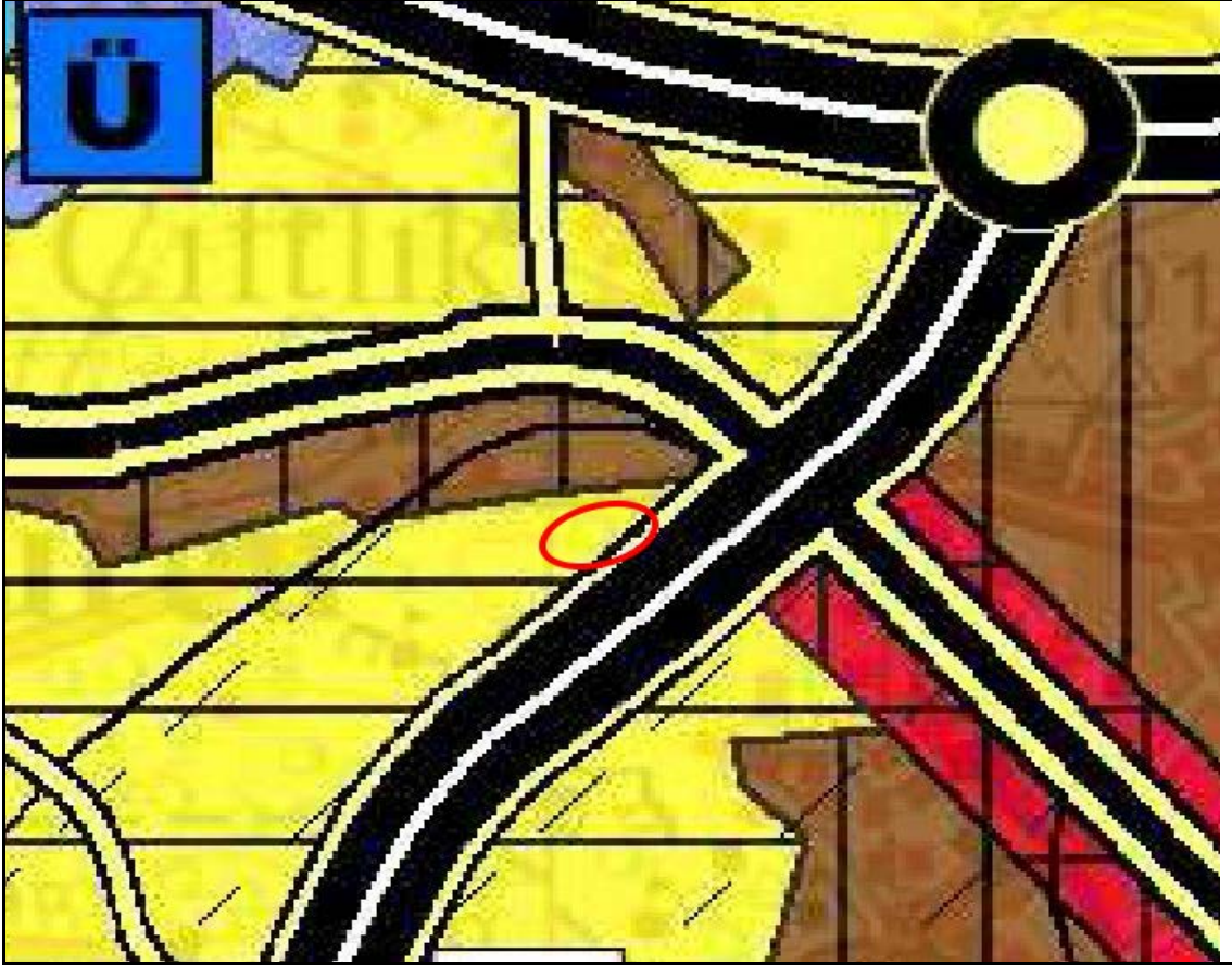
Şekil 2: 1/100000 ölçekli Çevre Düzeni Planı

Mersin İli, Tarsus İlçesi Atatürk Mahallesi 4926 ada 2 parsel ve çevresi, yürürlükte bulunan Mersin 1/100000 ölçekli İl Çevre Düzeni Planında Kentsel Gelişme Alanı olarak tanımlı alanda kalmaktadır.