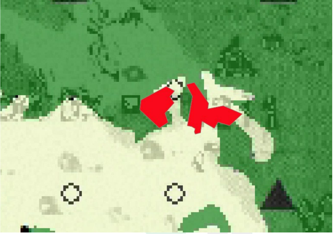
Harita 2: Planlama Alanı 1/100.000 Ölçekli Çevre Düzeni Planı

ve Orman ” da kalmaktadır. 1 Planlama alanına dair 1/25.000, 1/5000, 1/1000 ölçekli planlar bulunmamaktadır.