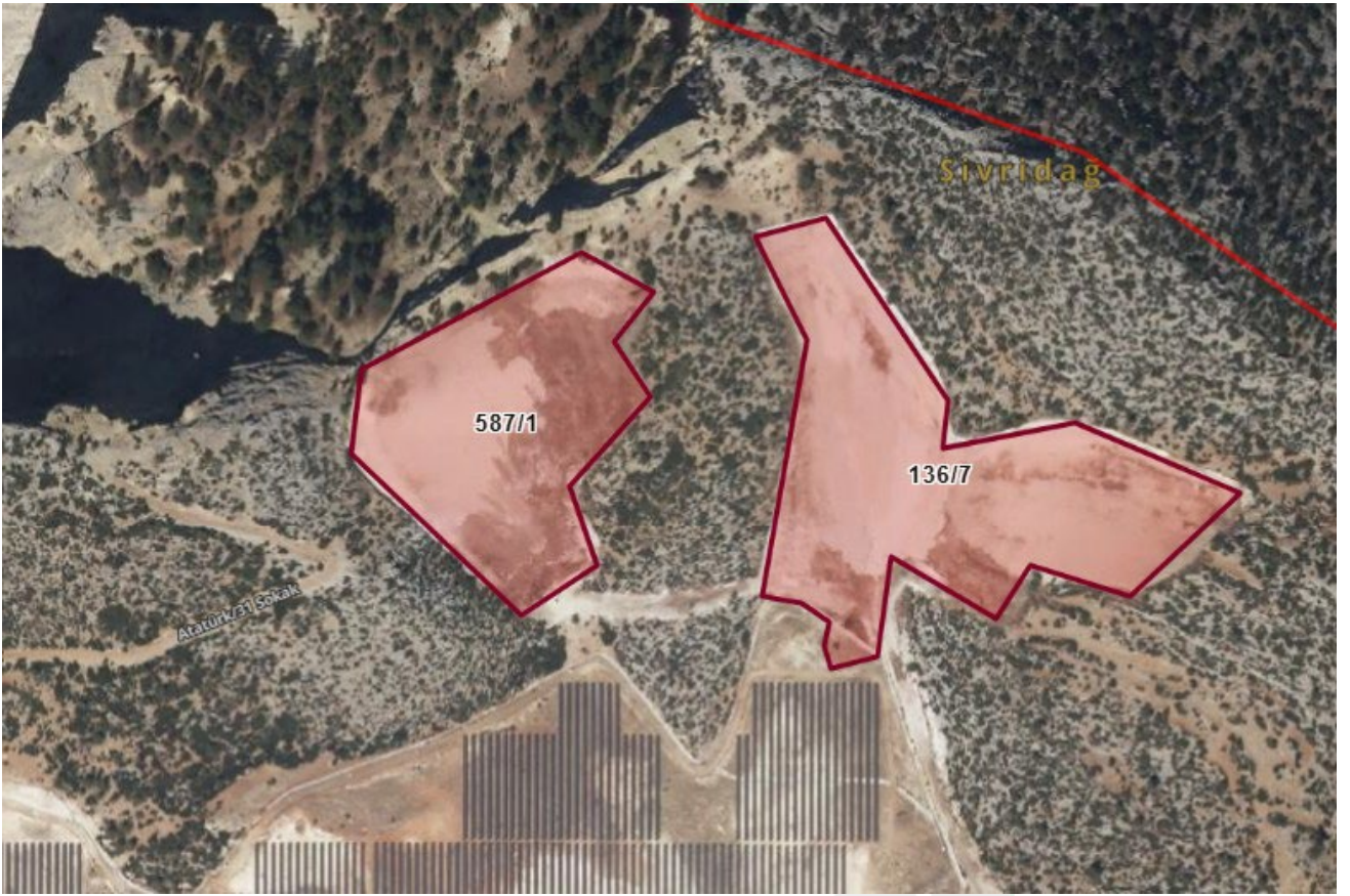
Harita 1: Planlama alanı ve Çevresi

Planlama alanı Mersin'in Gülnar ilçesinde Kuskan Erenler mahalle sınırları içerisinde bulunmaktadır. Gülnar ilçesi; Güneydoğu Anadolu, Doğu ve Batı Akdeniz ile iç ve Batı Anadolu'yu birbirine bağlayan Devlet Karayolu ağının kavşak noktasında olup, il merkezi Mersin'e 220 km mesafededir. Planlama alanı; Kuskan Erenler mahalle merkezinin yaklaşık 5.5 km. kuzeyinde, ilçe merkezinin yaklaşık 25 km kuzeybatısında yer almaktadır.