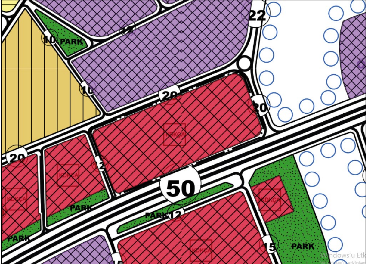
Harita 2:Öneri 1/5000 ölçekli Nazım İmar Planı

Bu amaçla hazırlanan teklif Nazım İmar Planı Değişikliğinde söz konusu imar adası “Konut Dışı Kentsel Çalışma Alanı (KDKÇA)” olarak plana işaretlenmiştir.